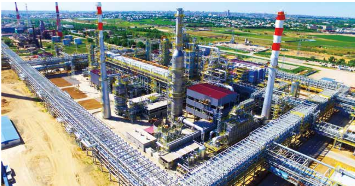
中国出口信用保险公司承保的哈萨克斯坦奇姆肯特炼油厂项目。

保金额1197.6亿美元；短期出口信用保险累计实现承保金额2.2万亿美元；承保外贸综合服务平台和跨境电商业务341.1亿美元，支持机电产品、高新技术、船舶、汽车、轻工等八大重点行业1.78万亿美元，为外贸稳增长、调结构作出了积极贡献。三是大力支持小微企业发展。中国信保积极落实国家普惠金融政策，2013年至2018年11月，累计支持小微企业出口3063.9亿美元，服务小微企业超过11万家。其中，2018年1-11月新增2.2万家，对全国小微企业覆盖率达到28.9%，有效解决了小微企业“有单不敢接、有单无力接”的难题。四是为稳定社会就业发挥了积极作用。国务院发展研究中心发布的《中国信保政策性职能履行评估报告》显示，2013年以来，中国信保通过履行政策性职能，每年拉动或保障与外贸出口相关的就业人数1500万左右，约占我国外贸行业从业人员的十分之一。